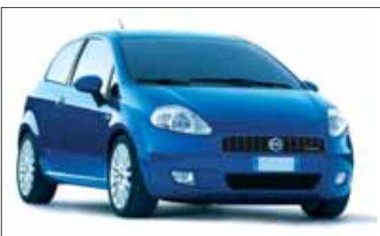
NUOVA FIAT PUNTO NATURAL POWER EGPL